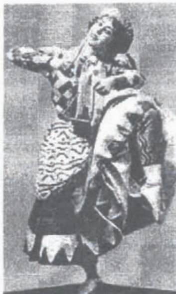
Броніслава Ніжинська в ролі Петрушки з однойменного балету Ігоря Стравінського. 1911 р.

У 1917 році Б. Ніжинська багато виступала окрім сцени міської опери. 6 січня вона взяла участь у вечорі, влаштованому Дамським комітетом округу шляхів сполучення для придбання подарунків воїнам 7 . 6 лютого у виставі «Gala» з нагоди при-