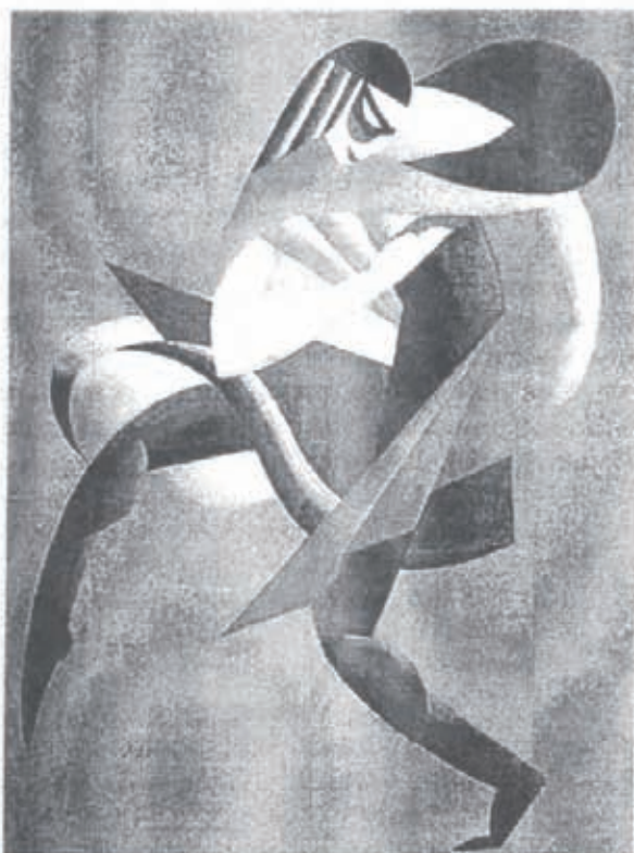
В. Мелер. Маска. Ескіз костюма для балетної студії Б. Ніжинської. 1919. Гуаш на картоні

Всеукраїнській виставці Асоціації революційного мистецтва України (Харків–Київ–Берлін), а також на Виставці мистецтв народів СРСР (Москва). Цікаво й те, що спостереження за новаторським підходом Б. Ніжинської до розробки хореографічних вистав дозволило згодом сценографу випробувати власні сили у створенні пластичного руху на сцені пролетарського драматичного театру-студії ім. Г. Михайличенка в постановці «Небо горить» 25 .