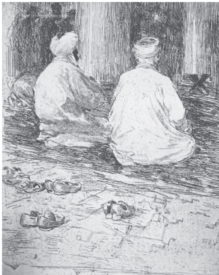
В. Андреев. У мечеті. Офорт. 23 см x 15,5 см; 31,5 см x 18,5 см