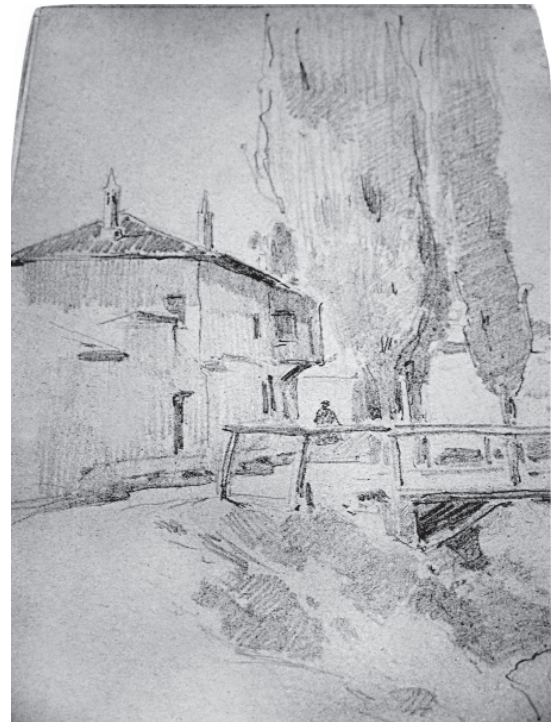
В. Андреев. Малюнки з альбому. 1894. Папір, олівець. 32,1 см x 23,5 см