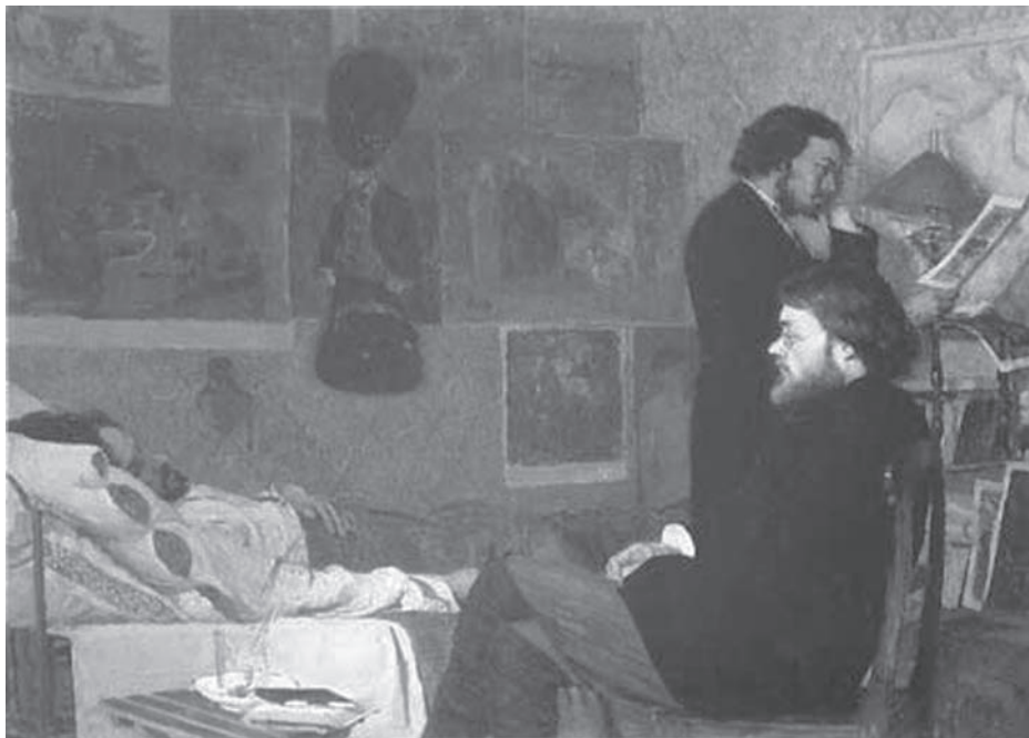
Кириак Костанді. У хворого товариша. 1883 р. Полотно, олія. Державна Третьяковська галерея, Москва