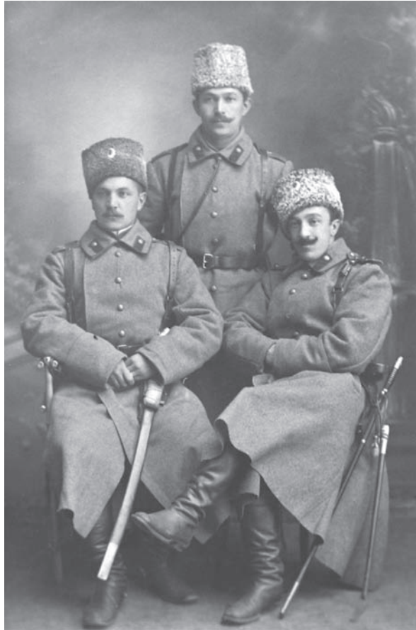
Данило Щербаківський (у центрі) під час Першої світової війни